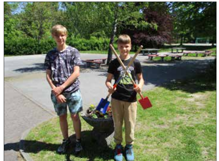
Überraschung gelungen

In einem Gespräch mit Schülern und mir kam der Gedanke auf, die (wiedermal!) mit Unkraut zugewachsenen Pflanzschalen auf unserem Schulhof neu zu bepflanzen. Diese boten einen traurigen Anblick. Bisher ist es leider nicht gelungen, eine Klasse oder ein Ganztagsangebot zu begeistern, sich regelmäßig um die Pflanzschalen zu kümmern. Also müssen wir mit Freiwilligen Hand anlegen! Hier war dann leider bei einigen Schülern, die erst begeistert waren, die Lust verfliegen - schade!