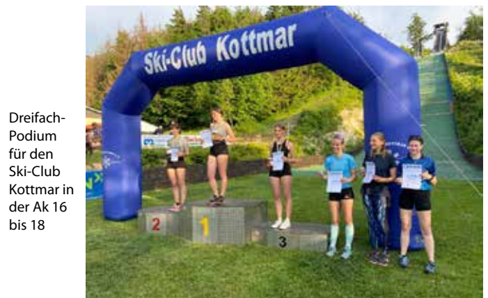
Dreifach-Podium für den Ski-Club Kottmar in der Ak 16 bis 18