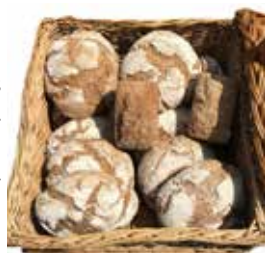
Kulturverein Oberland e.V.