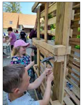
Hier entstehen neue Produkte