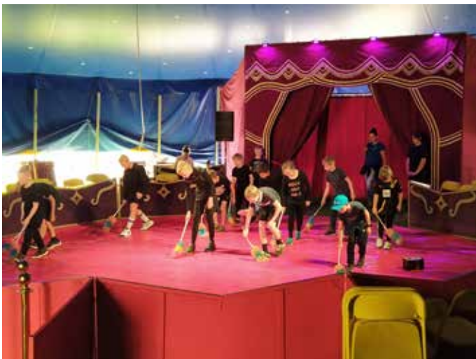
Auftritt der Clowns

jedes Kind mit Herz und Freude mitmacht, obwohl sicher das eine oder andere Lampenfieber dabei ist. Kinder, Ihr wart alle großartig! Danke für die Freude, die Ihr uns Eltern, Großeltern, Geschwistern und Gästen damit bereitet habt. Und natürlich gilt der Dank auch allen weiteren Beteiligten, wie beispielsweise Zirkustrainer, Schulleitung, Organisatoren, Förderverein oder Helfer des Auf- und Abbaus. Nur so konnte solch ein tolles Projekt ins Leben gerufen werden. Danke! Möge der Weg für derartige Projekte auch weiterhin erhalten bleiben. Manege frei!