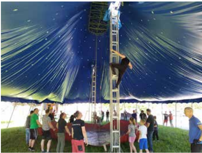
Aufbau des Zirkuszelt

Endlich! Sehnsüchtig hat man darauf gewartet und nun ist es endlich vollbracht. Der Mitmachzirkus Blubber reiste zu uns nach Ebersbach und bot unseren Kindern der Jahn-Grundschule ein umfangreiches und spannendes Projekt an. Am ersten Tag stellten die Zirkusartisten eine vielfältige Form von Angeboten vor, bei denen sich die Kinder ihre Vorstellungen aussuchen durften. Ob Zirkusdirektoren, Clowns, Tellerdreher, Jongleure, Akrobaten, Seiltänzer, Ringtrapezkünstler oder Piraten - jedes Kind war ermutigt, sich darin auszuprobieren. Zwei Tage wurde trainiert und am vierten und fünften Tag kamen Generalproben und schließlich die ersehnten Hauptvorstellungen in dem voll besuchten Zirkuszelt. Manege frei! Und hierbei kann man sagen: Respekt vor allen Kindern und Trainern! Es ist erstaunlich zu sehen, in welcher kurzen Zeit unsere Kinder so viel gelernt haben! Es gehören Mut und Fleiß dazu, Motivation und Zusammenhalt, um solch ein Programm zu absolvieren. Dabei ist es nicht entscheidend, ob alles immer sofort und in Perfektion funktioniert. Vielmehr kommt es darauf an, dass