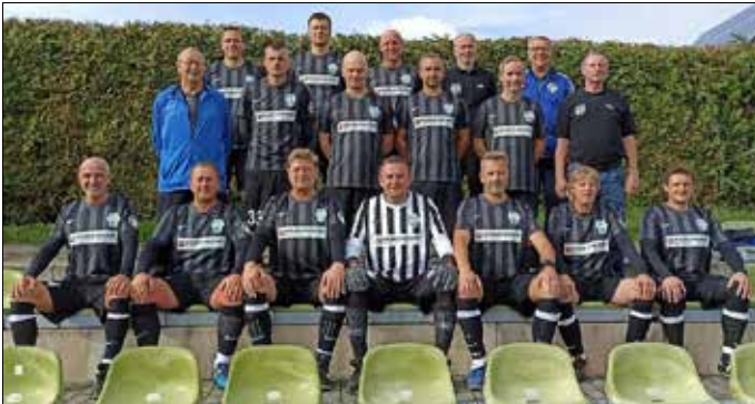
„Alten Herren“ in der Kreisliga Süd