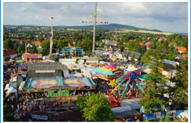
Einladung zum Badfest im Volksbad am 07.07. und 08.07.2023