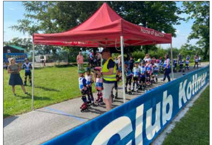
Als erstes durften die ganz Kleinen auf die Strecke